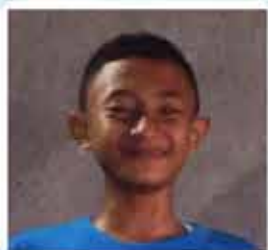
Azka Juadi MI Roudhotut Tholibin Ds Tanggul Rejo Gresik