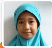
Fitriyya Habiba Mecca TK Alam Jabalussalam kota balikpapan